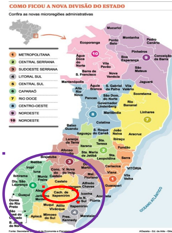
Figura 2 – Mapa das microrregiões capixabas. FONTE: A Gazeta, 2011.

afinidade, em 26 de dezembro de 2011, o Governo do Estado publicou a Lei n.º 9.768, reduzindo as microrregiões capixabas de 12 para 10, conforme demonstra o mapa: