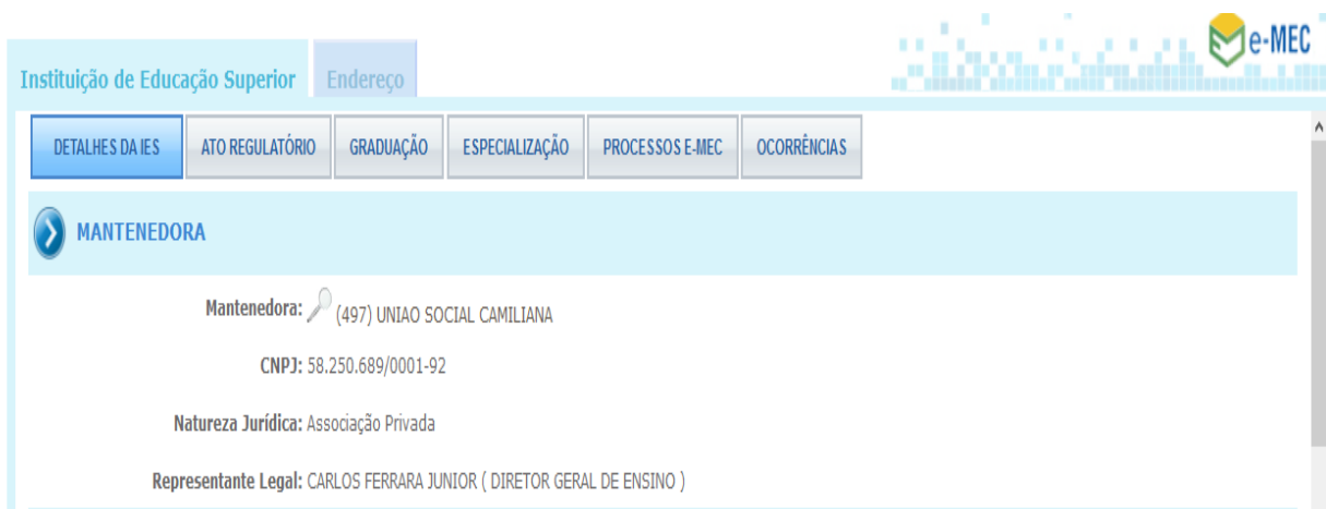
Figura 1 – Dados da mantenedora.

A União Social Camiliana, presente atualmente em 35 países dos cinco continentes, fundada em Roma por São Camilo de Lellis, em 1582, dedica-se ao ideal da assistência integral aos enfermos e à promoção da Saúde, dedicando especial ênfase à valorização da pessoa humana e da vida, empenhando-se em preservá-la, mantê-la e desenvolvê-la até os limites de suas possibilidades, repudiando tudo quanto possa agredi-la ou diminuí-la em sua plena expressão.