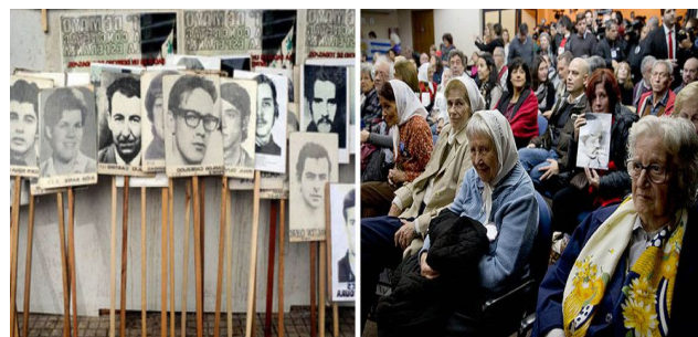
Imagem de desaparecidos, mortos e familiares das vítimas da Ditadura na América Latina e da Operação Condor.

11. A Justiça argentina declarou culpados oficiais militares por participarem da Operação Condor, cooperação entre regimes autoritários da América do Sul entre as décadas de 1960 a 1980, para combate à "subversão" nos países. O tribunal de Buenos Aires condenou o último presidente de fato do país, Reynaldo Bignone (1982-1983), a 20 anos de prisão por crimes de lesa-humanidade. 17 militares - 16 argentinos e um uruguaio - foram condenados por sequestro, tortura e desaparecimento forçados. Nos anos de 1960/1980, vários países da América Latina sofreram intervenções militares.