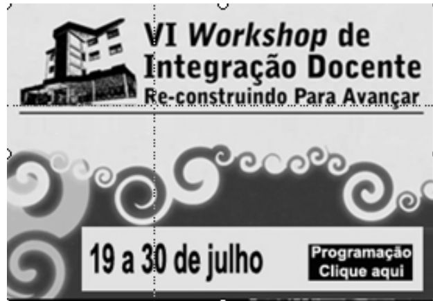
Fig. 1. Uma figura típica